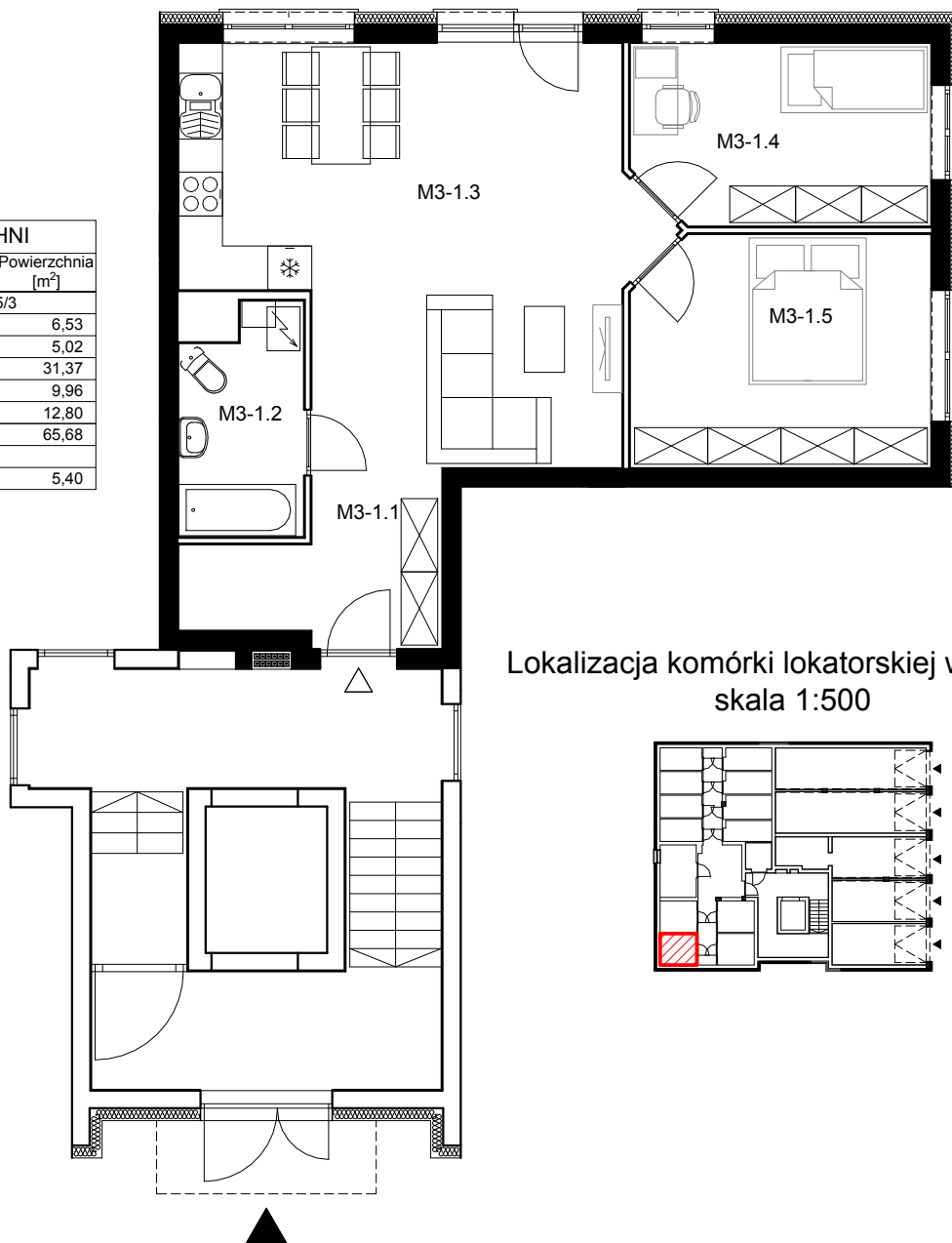
Lokalizacja komórki lokatorskiej w piwnicy skala 1:500